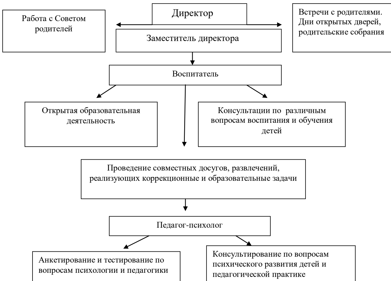
Рис. 1 «Схема взаимодействия с семьями воспитанников»